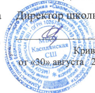
Кривцов И. М. от «30» августа 2024 г.